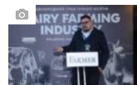
Конференції Міжнародний практичний форум DAIRY FARMING INDUSTRY, 11-12 березня 2026