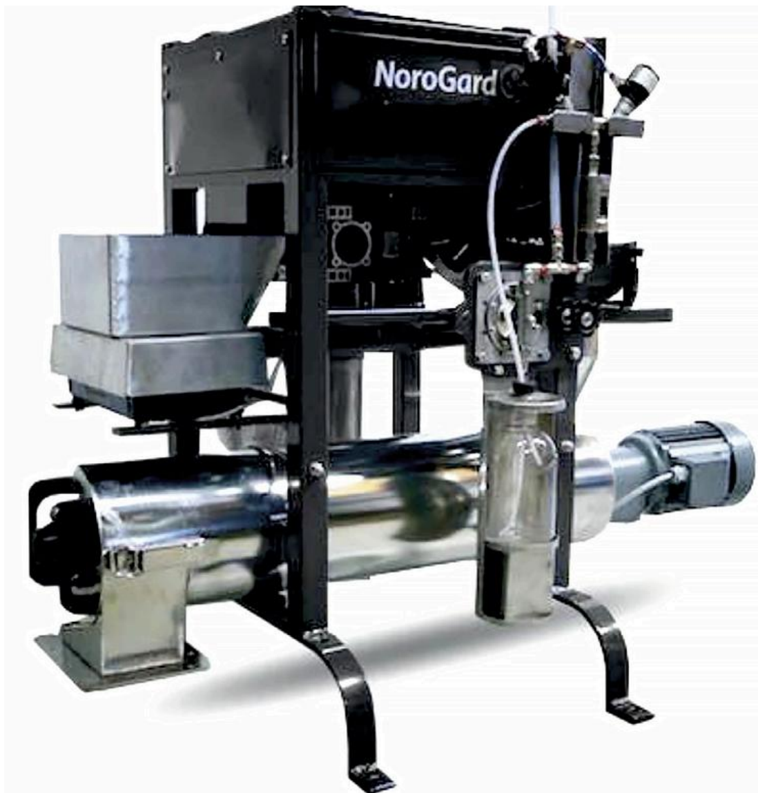
Потоковий протруювач WESTRUP

Лабораторні протруювачі — незамінні машини для точного аналізу ефективності протруювання на невеликих партіях насіння перед масштабним застосуванням протруйників. Їх