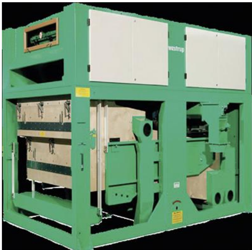
Fine cleaner WESTRUP (тонке очищення)

вироблене та сертифіковане в Україні, відповідає стандартам ЄС та може експортуватися на ринок Євросоюзу.