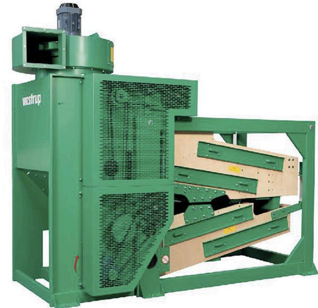
Pre cleaner WESTRUP (первінна очистка)